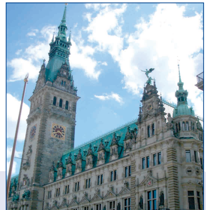
Fachtagung im Hamburger Rathaus